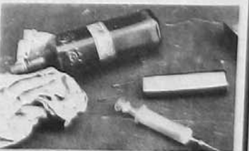
La jeringuilla del pintor.

en un descuido de la chica, se lanza sobre ella para clavarle la jeringuilla. Esta vez, en la espalda. Sin embargo, antes de que la punta de la terrorífica aguja toque la piel de la desdichada, la mujer saca de debajo de su trasero, una pistola Magnum 357 y apunta a Louis: "Si mueves un pelo te vacío el cargador en la cabeza, maldito pintor hijo de mala madre". La mujer policía, desnuda, se pone de pie y le pone las esposas. La detención fue una casualidad. Modelo de día y policía de noche. Mala suerte.