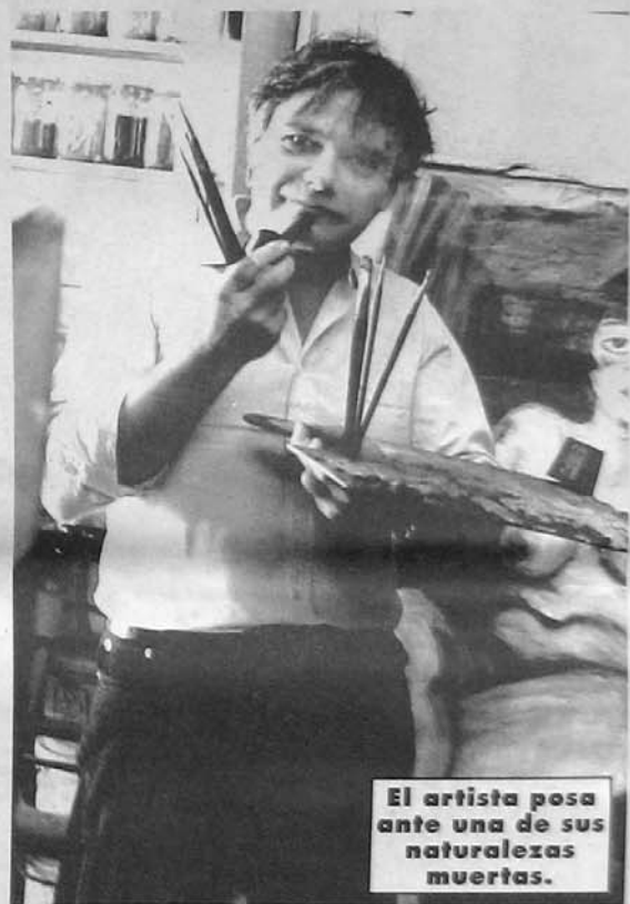
El artista posa ante una de sus naturalezas muertas.