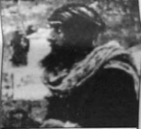
Boabdil fue el último en abandonar España.

Aquí es donde entra la figura de un conocido prófugo de la Justicia. A cambio de 1.500 millones de pesetas, el fugado habría vendido los planos del subsuelo de las principales ciudades españolas con sus puntos neurálgicos marcados. Además, unos documentos del Frente Islámico Reconstituido aseguran que