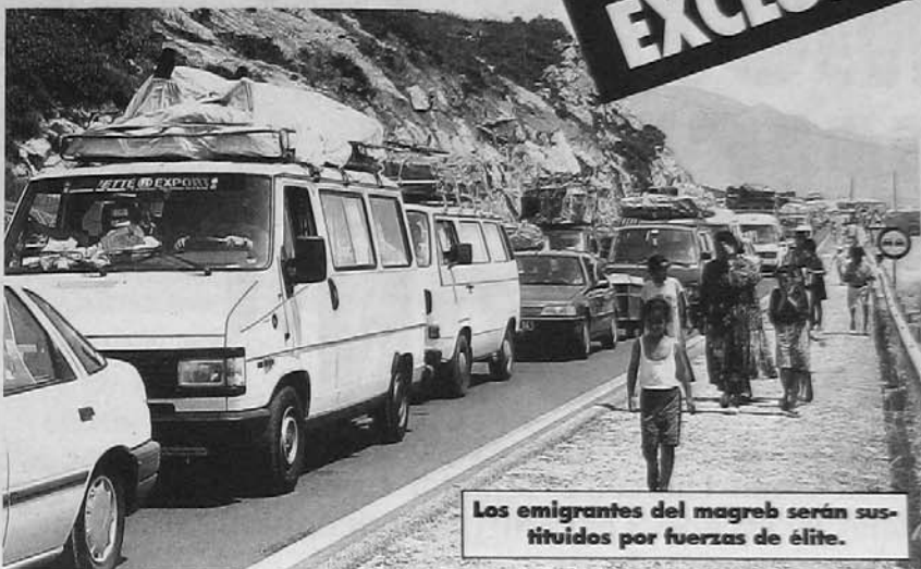
Los emigrantes del magreb serán sustituidos por fuerzas de élite.

La "Operación Boabdil", en clara referencia al último rey árabe de Granada en la Edad Media, prevé apoderarse de los pasaportes de todos los súbditos árabes que tienen permiso de trabajo y residencia en algún país europeo y entregárselos a fuerzas de élite del ejército de su país. Así, pasarán a la vuelta de las vacaciones más de un millón de militares que se concentrarán en diferentes puntos de Andalucía para recoger armamento ligero y semipesado que habrían ido llevando allí las mismas redes mafiosas que desde